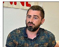
Recruter dans les localités est primordial pour le responsable CGT cheminots de Narbonne. P.L.

Le développement du trafic passager est un des objectifs de la convention TER/SNCF. D'ici 2032, le seul des 100 000 passagers journaliers devrait être atteint. Cette augmentation va impliquer un plus grand besoin de travailleurs. Le système de retraites par répartition fonctionne uniquement s'il y a de l'emploi. La solution pour combler les be-